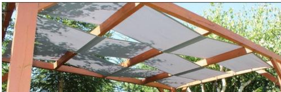
Rysunek 1. Pasy altanowe/rzymskie z materiału Premium Decor